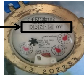
Mätaren i exemplet ovan visar 215 kbm